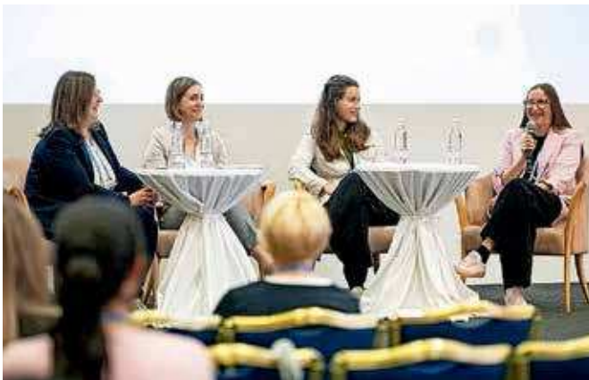
Kongres zdravstvene administracije