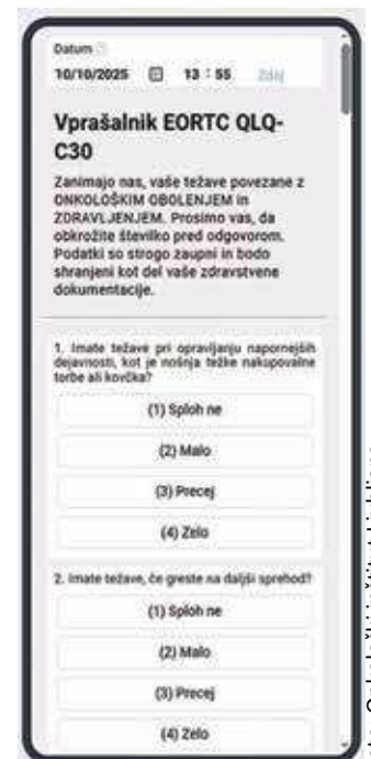
Izpolnjevanje vprašalnika prek SMS